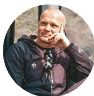
KRZYSZTOFA PODRÓŻE BEZ PLANU